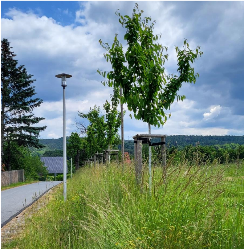
Obstbaumpflanzung am Bäckerweg