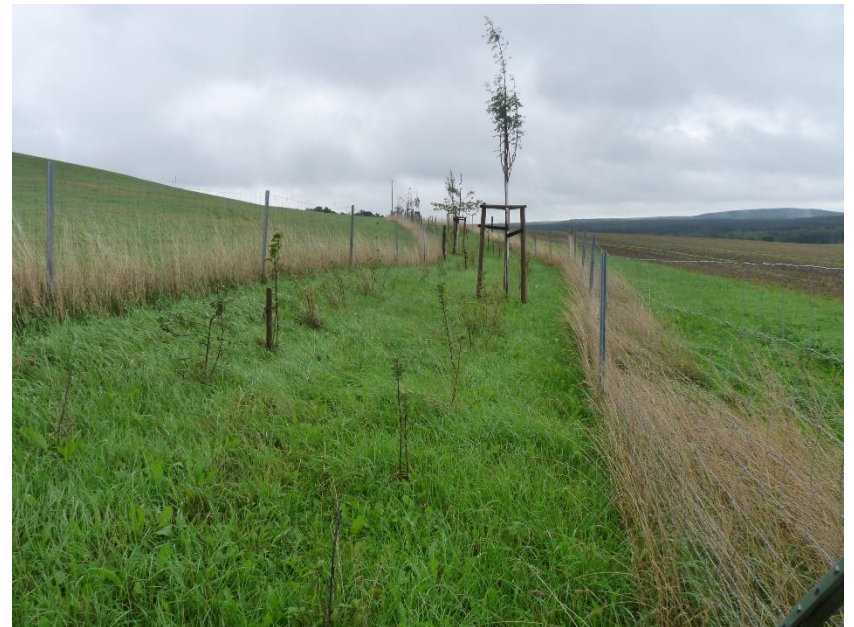
Feldhecke am Harthenberg