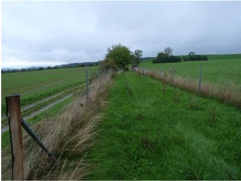
Feldhecke am Ebschenweg